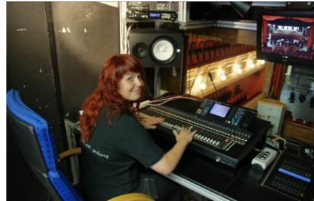
Arbeiten im Technikraum