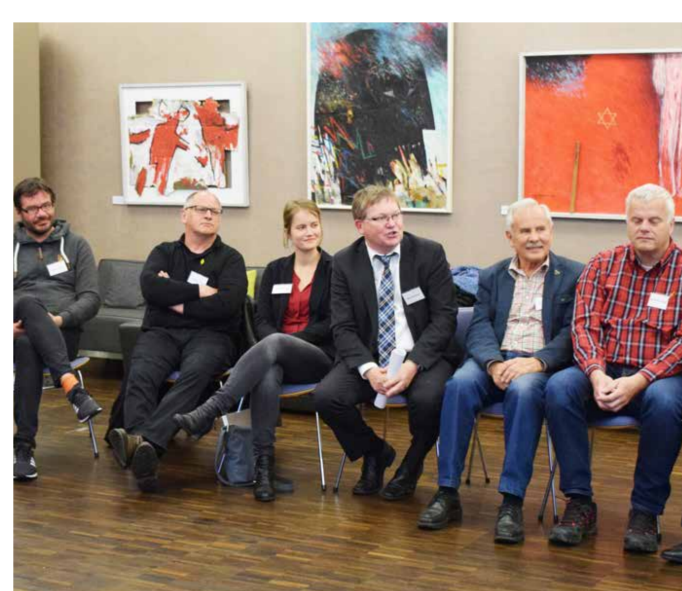
Impressionen aus dem Steuerkreis