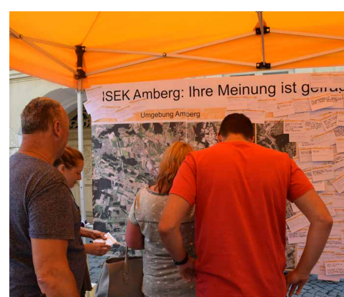
Impressionen vom Mobilstand