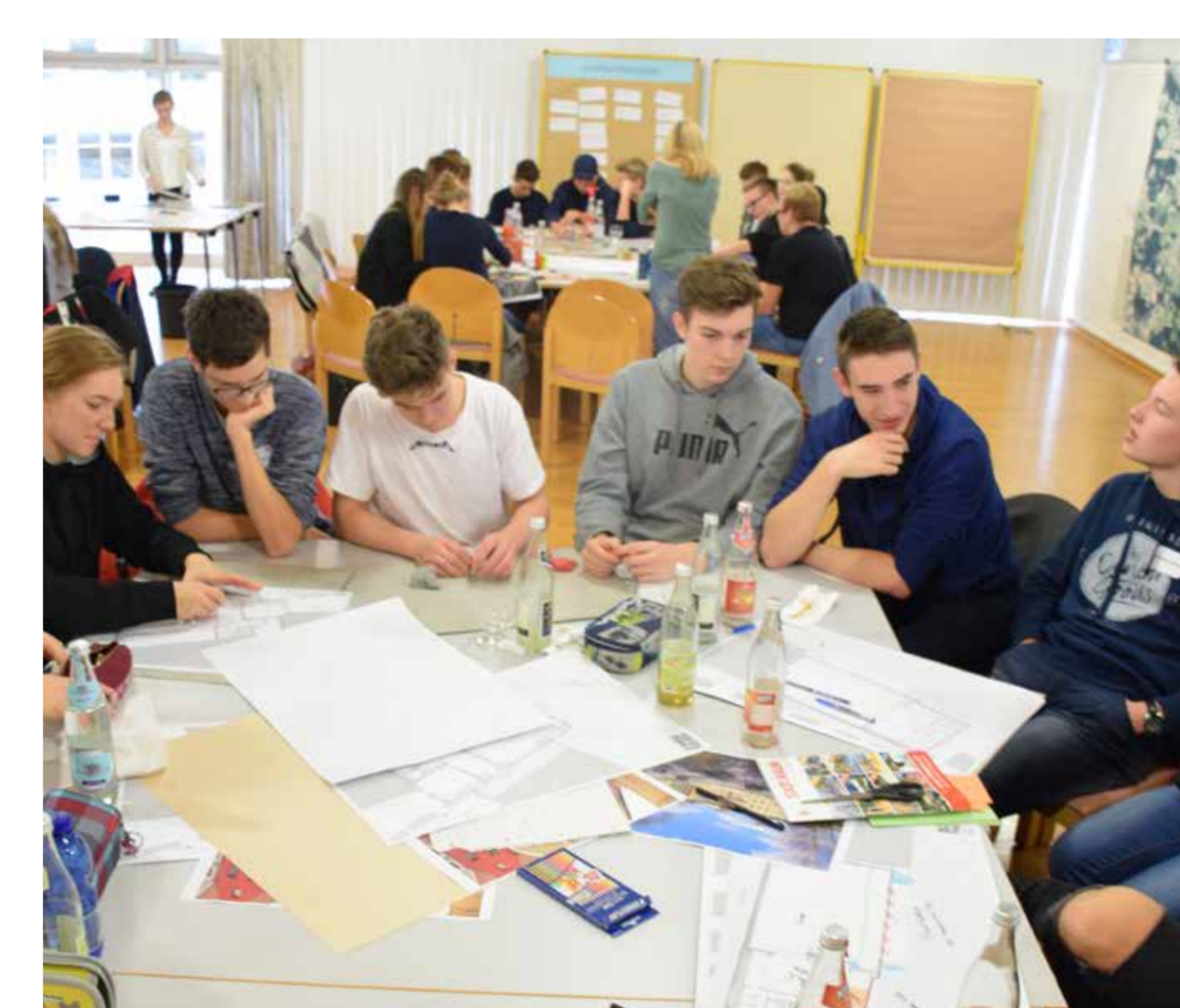
Impressionen aus der Schülerbeteiligung