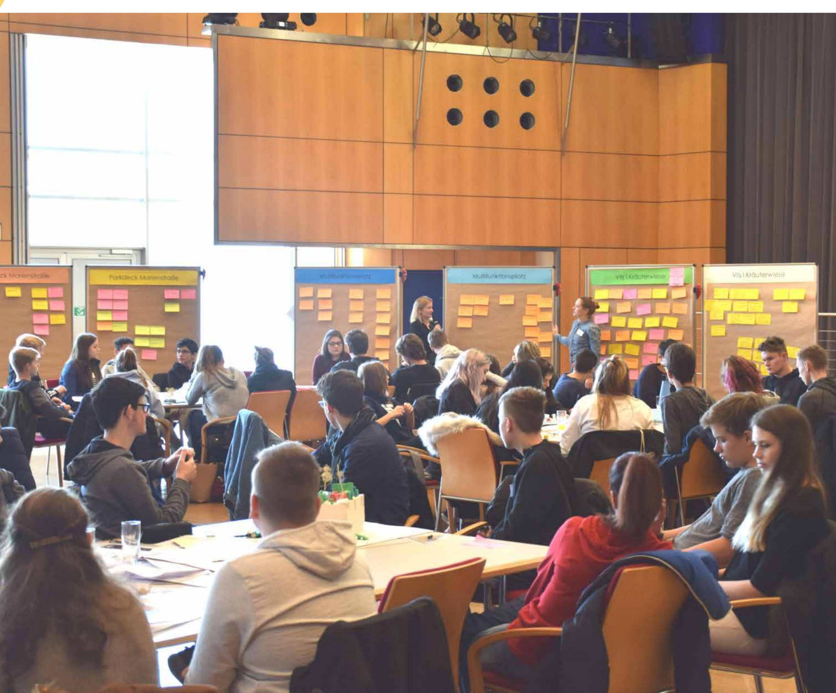
Impressionen aus der Schülerbeteiligung

Die jüngeren Generationen der Stadt Amberg wurden durch zwei Schulbeteiligungen am 07. November 2017 und am 24. November 2017 am Planungsprozess beteiligt. Dieses Veranstaltungsformat richtete sich an die weiterführenden Schulen der Stadt. Der Beteiligungsprozess wurde genutzt, um konkrete Ideen für die Nutzung des Multifunktionsplatzes, des Parkdecks an der Marienhilfsstraße, eines Gebäudes am Rossmarkt und des Josefshauses zu entwickeln. Durch die rege Beteiligung und Kreativität der Schüler*innen entstand ein breites Spektrum an Nutzungskonzepten, die anschließend im Rahmen des ISEK mitberücksichtigt wurden.