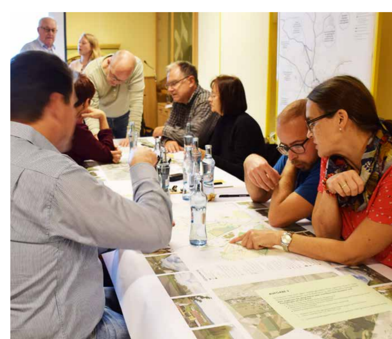
Impressionen aus den Wirtshausgesprächen