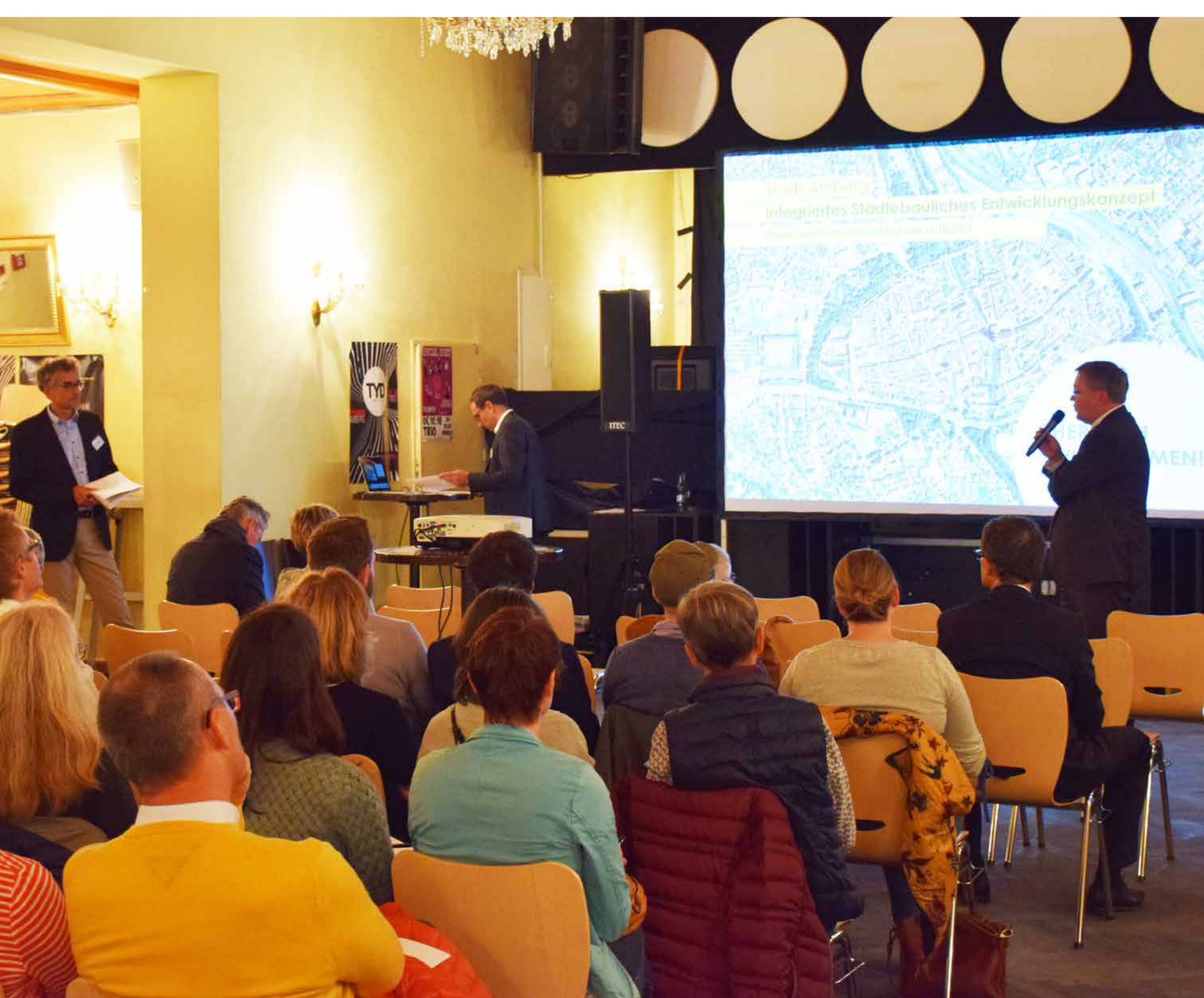
Impressionen aus der Planungswerkstatt

Neben den zahlreichen Veranstaltungen im Rahmen des ISEK-Prozesses konnten sich die Bürger*innen kontinuierlich über die städtische Homepage, diverse Zeitungsartikel und Flyer über den aktuellen Planungsprozess informieren. Daneben bestand für die Bürger*innen die Möglichkeit, über die Projektemailadresse direkten Kontakt mit den Planer*innen aufzunehmen. Zusätzlich konnten sich interessierte Bürger*innen auf einen Informationsverteiler setzen lassen, um direkt per E-Mail über aktuelle Veranstaltungen im Rahmen des ISEK informiert zu werden.