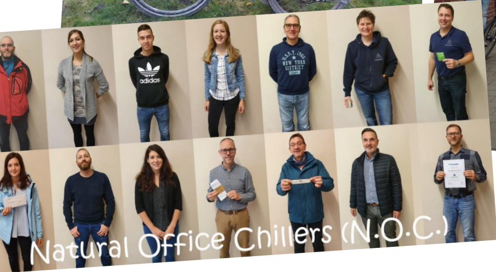
Natural Office Chillers (N.O.C.)