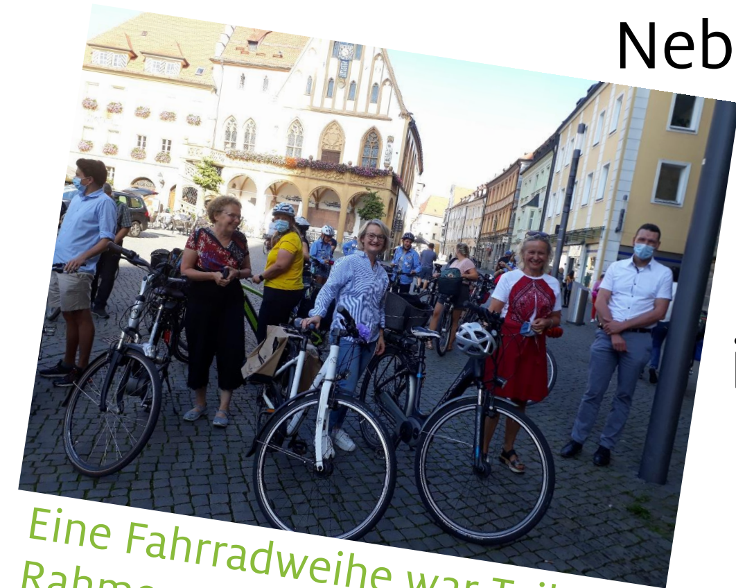
Eine Fahrradweihe war Teil des Rahmenprogramms.