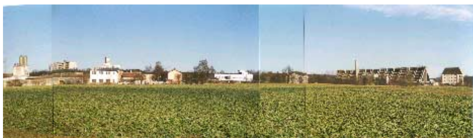
Fernwirkung von Westen, Gewerbegebiet