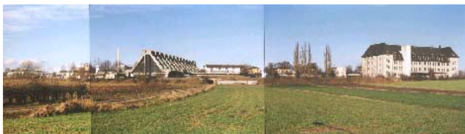
Fernwirkung von Süden Glasfabrik und Heereszeugamt