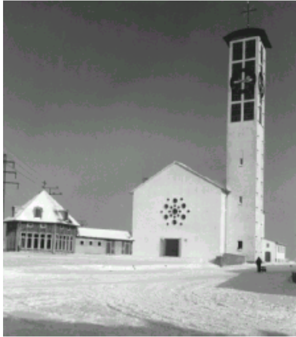
Kirche Hl. Familie 1956