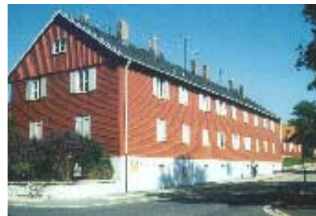
Baracken Breslauer Straße

Weitere Bereiche mit völlig ungeordneter Entwicklung stellen auf einigen Grundstücken Garagenbauten dar. Insbesondere in der Egerlandstraße hat sich um ein Wohngebäude herum eine störende Ansammlung von Garagenbauten entwickelt. Aber auch auf anderen Grundstücken wie z.B. am Claudiweg und auf der Brachfläche im Anschluß an die Rosenthalstraße wurde der Bedarf nach Garagen und Kellerersatzbauten ungeplant realisiert.