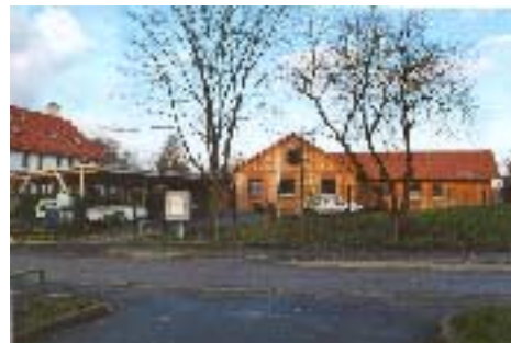
Caritas Sozial Station

Die Reihenhäuser entsprechen in ihrer Baukörperausformung nicht dem städtebaulichen Rahmen der Umgebung, außerdem ist die enge Stellung der Gebäude dem Stadtviertel nicht angemessen. Darüber hinaus wurden zu wenige Stellplätze geschaffen, was sich in einem erhöhtem Parkdruck entlang der Breslauer Straße niederschlägt.