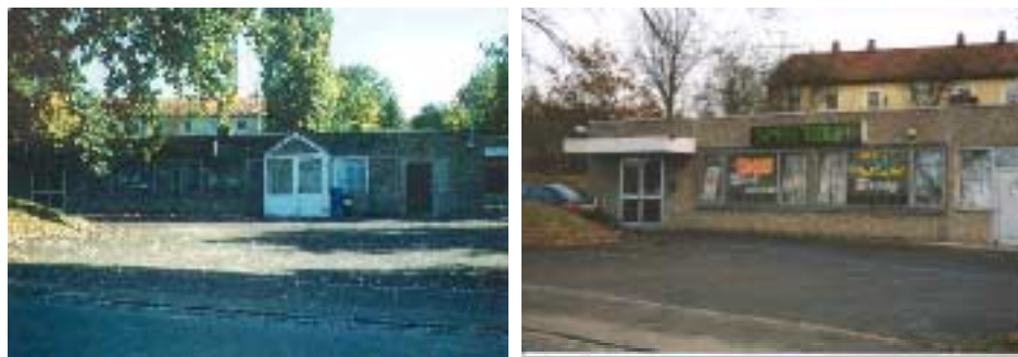
Gerresheimer Straße 45

Auch einige der in den 70er Jahren entstandenen Wohnblocks fügen sich nicht in das vorgegebene Gefüge und städtebauliche Grundkonzept aus den 50er Jahren ein, vor allem die unruhige Baukörperausformung und die Lage im Grundstück wirken sich negativ aus. Darüber hinaus sind die Gebäude Danziger Straße 2 und Breslauer Straße 1 mit acht und sieben Geschossen im Vergleich zur umgebenden Bebauung eindeutig zu hoch und stören durch ihre Unmaßstäblichkeit das Gesamtbild erheblich.