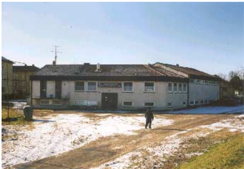
Sportheim des Inter Bergsteig

Einen Beginn eines Ortsrands hingegen bildet das Sportheim des Inter Bergsteig. Wenngleich der Baukörper in seiner Ausformung architektonisch unbefriedigend ist, so ist die städtebauliche Ausrichtung grundsätzlich positiv und kann durch eine Erweiterung im Bereich Jugend und Freizeit bzw. auch der Ringersparte zu einer Verstärkung der Abrundung des Ortsbildes im Übergang zum Gewerbegebiet beitragen. Wobei es wünschenswert ist das Gebäude nach Süd-Ost zu erweitern, um auch der Breslauer Straße, die hier in einem Wendehammer enden sollte, besser zu fangen.