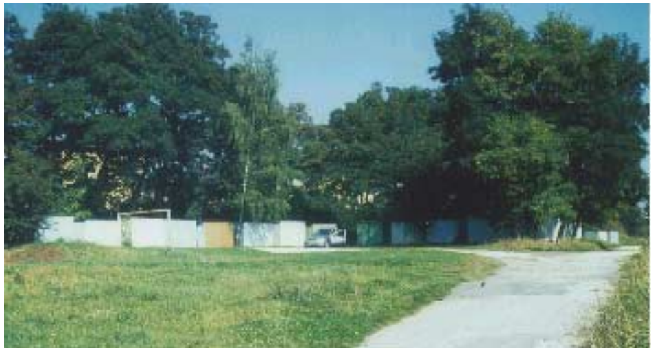
Wellblechgaragen und Kellerersatzräume

Eine städtebaulich unbefriedigende Lösung stellt auch das Gebäude Rosenthalstraße 27 dar. Hier wurde offensichtlich, aus welchen Gründen ist uns nicht bekannt, auf eine notwendige Baukörperergänzung verzichtet. Die wohl geplante Entwicklung in diesem Bereich entlang der Rosenthalstraße wurde nicht realisiert und ist nach heutigen Maßstäben, auch aus Gründen der Erschließung, völlig unzureichend gelöst. Zu hoffen ist, daß sich im Zuge der baulichen Entwicklung entlang der Rosenthalstraße auf den Brachflächen hierzu Gesamtlösungen verwirklichen lassen, die die bestehenden Probleme ( auch das Parkproblem) mit beseitigen.