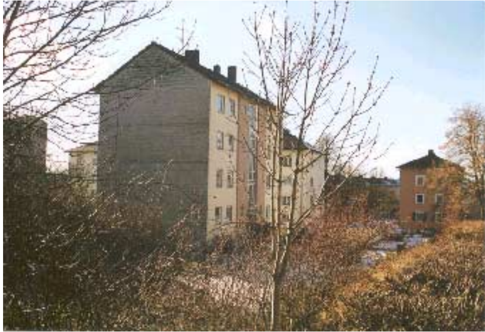
Gebäude Rosenthalstraße 27

Einen Beginn eines Ortsrands hingegen bildet das Sportheim des Inter Bergsteig. Wenngleich der Baukörper in seiner Ausformung architektonisch unbefriedigend ist, so ist die städtebauliche Ausrichtung grundsätzlich positiv und kann durch eine Erweiterung im Bereich Jugend und Freizeit bzw. auch der Ringersparte zu einer Verstärkung der Abrundung des Ortsbildes im Übergang zum Gewerbegebiet beitragen. Wobei es wünschenswert ist das Gebäude nach Süd-Ost zu erweitern, um auch der Breslauer Straße, die hier in einem Wendehammer enden sollte, besser zu fangen.