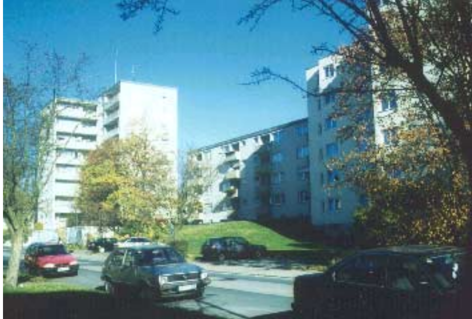
Wohnbebauung Danziger Straße 2 und Breslauer Straße 1

Konflikt für eine abschließende Beurteilung: die städtebaulich erhaltenswerten Gebäude müssten aufgrund des baulichen Zustands abgebrochen werden während die als ortsbildstörend bewerteten aus wirtschaftlichen Überlegungen unangetastet bleiben.