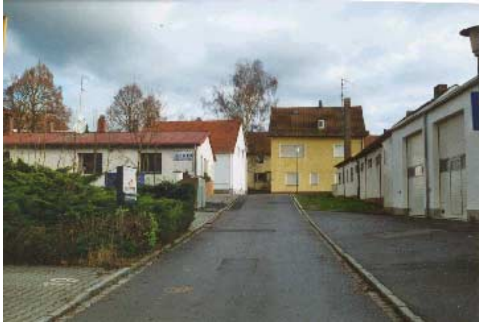
Danziger Straße, rechts Metzgereibetrieb