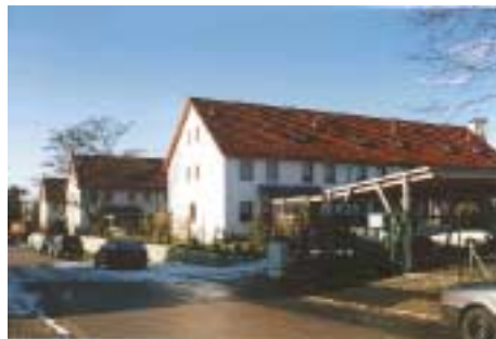
Reihenhäuser Breslauer Straße

Eine städtebaulich unbefriedigende Entwicklung stellen auch die Reihenhäuser an der Breslauer Straße und die Sozialstation an der Königsberger Straße dar.