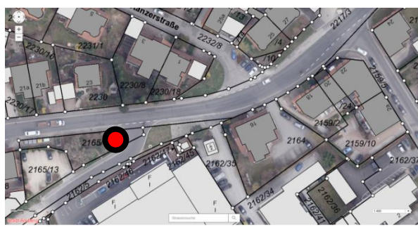
Jahnstraße – Einmündung Emailfabrikstraße