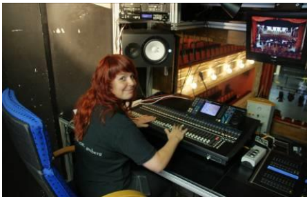
Arbeiten im Technikraum