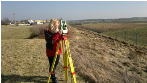
Vermessungstechnikerin im Außendienst

Vermessungstechniker/-innen führen vor Ort Vermessungen durch und verarbeiten bzw. visualisieren die gewonnenen Daten am Computer, um z.B. Pläne, Karten, Kataster oder Risswerke zu erstellen und zu aktualisieren.