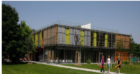
Berufsschule für Gartenbau, Floristik und Vermessungstechnik, München