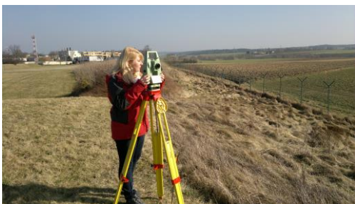
Vermessungstechnikerin im Außendienst

Vermessungstechniker/-innen führen vor Ort Vermessungen durch und verarbeiten bzw. visualisieren die gewonnenen Daten am Computer, um z.B. Pläne, Karten, Kataster oder Risswerke zu erstellen und zu aktualisieren.