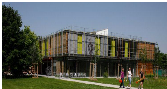
Berufsschule für Gartenbau, Floristik und Vermessungstechnik, München