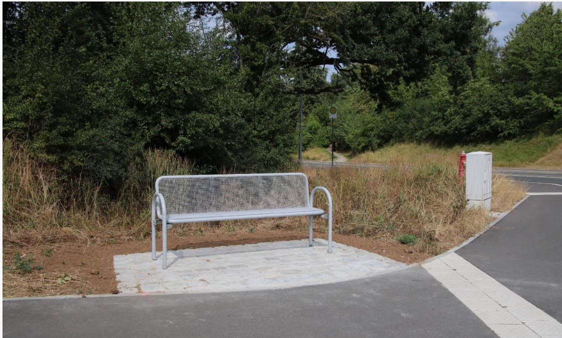
2022 neu errichteter Sitzplatz

Am neuen Kreisverkehr Haager Weg / Gailoher Hauptstraße / Von-Scheffel-Straße